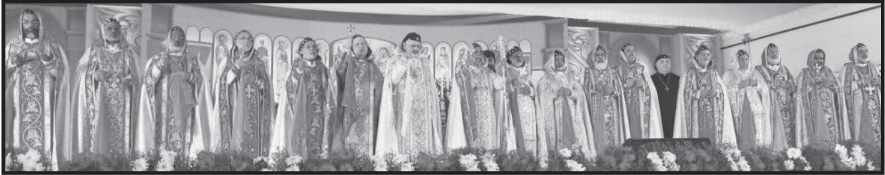
നവാഭിഷിക്തരായ ബിഷപ്പുമാരെടൊപ്പം സഭയിലെ മെത്രാപുന്മാരും കാതോലിക്കാ ബാവായും പാത്രിയർക്കീസ് ബാവായും വിശ്വാസികളെ ആശീർവദിക്കുന്നു.