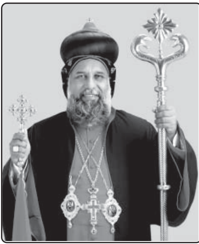
പൗരസ്ത്യ കാതോലിക്ക മോറാൻ മാർ ബസേലിയോസ് ക്ലീമീസ് ബാവ

ള്ളതുപോലെയുള്ള എല്ലാ രാഷ്ട്രീയ അധികാരങ്ങൾ പ്രയോഗിക്കുവാനും, രാജ്യതന്ത്രപ്രതിനിധികളെയും ആത്മീയ മേലദ്ധ്യക്ഷന്മാരെയും നിയോഗിക്കുവാനും