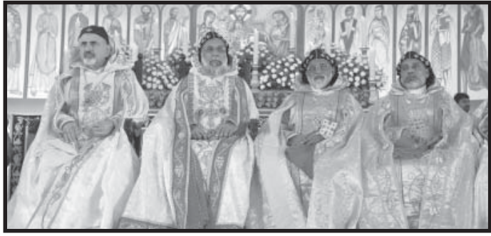
നവാഭിഷിക്തരായ മെത്രാന്മാർ മോറാർ മാർ ബസേലിയോസ് ക്ലീമീസ് കാതോലിക്കാ ബാവായ്ക്കും അന്ത്യോഖ്യൻ കത്തോലിക്കാ പാത്രിയർക്കീസിനും ഒപ്പം

വിശുദ്ധ യുദ്ധാശ്രീഹായുടെ വലിയ പെരുന്നാൾ അമ്മന്നൂർ: പരമ ഭക്തനും അസാദ്ധ്യകാര്യങ്ങളുടെ മദ്ധ്യസ്ഥനുമായ വി. യുദ്ധാ തദ്ദേശവാസിന്റെ പെരുന്നാൾ പതിവുപോലെ നവംബർ 25,26 തീയതികളിൽ പൂർവ്വാധികം ഭംഗിയായി ആഘോഷിക്കുന്നു. നാനാജാതി മതസ്ഥർ ഒരുമിച്ച് ആഘോഷിക്കുന്ന ഈ പെരുന്നാളിൽ വന്നു സംബന്ധിച്ച് അനുഗ്രഹം പ്രാപിക്കണമെന്ന് കർത്യമാമത്തിൽ അറിയിക്കുന്നു.