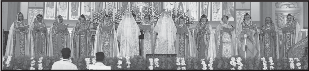
മെത്രാൻ അഭിഷേകത്തിന്റെ ഒരു ദൃശ്യം