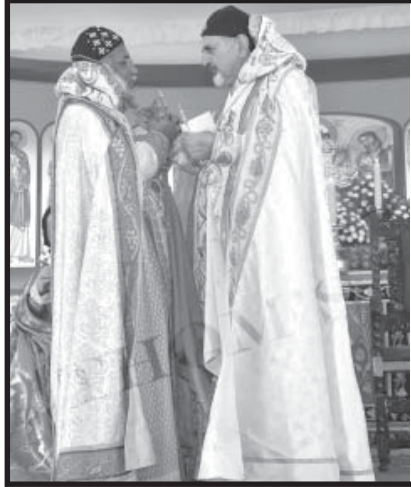
പൗരസ്ത്യ കാതോലിക്കായും മലങ്കര കത്തോലിക്കാ സഭയുടെതലവനുമായ കർദിനാൾ മോറാർ മോർ ബസേലിയോസ് ക്ലീമീസ് ബാവയും അന്ത്യോഖ്യൻ സുറിയാനി കത്തോലിക്കാ പാത്രിയർക്കീസ് ഇഗ്നാത്തിയോസ് യൂസഫ് യൗനാൻ ബാവയും മെത്രാൻ അഭിഷേക ചടങ്ങിൽ ആശയവിനിമയം നടത്തുന്നു.