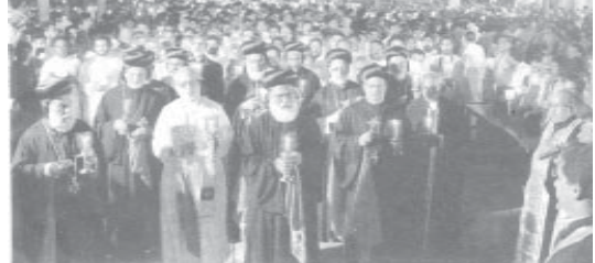
അനുഗ്രഹ വഴിയിൽ : ദൈവദാസൻ മാർ ഇവാന്യോസിന്റെ ഓർമ്മപ്പെരുന്നാളിനോടനുബന്ധിച്ചു തിരുവനന്തപുരം പട്ടം സെന്റ് മേരീസ് കത്തീഡ്രലിൽ നടത്തിയ മെഴുകുതിരി പ്രദക്ഷിണം. കർദ്ദിനാൾ മാർ ബസേലിയോസ് ക്ലീമീസ് കാതോലിക്കാ ബാവയും കർദ്ദിനാൾ മാർ ജോർജ്ജ് ആലഞ്ചേരിയും ബിഷപ്പുമാരും മുൻനിരയിൽ

കത്തീഡ്രൽ കവാടത്തിൽ കർദ്ദിനാൾ മാർ ജോർജ്ജ് ആലഞ്ചേരിക്ക് ഔദ്യോഗിക സ്വീകരണം നൽകി. കബറിൽ നിന്നും ദേവാലയത്തിലേക്കുള്ള പ്രദക്ഷിണത്തിൽ അഞ്ഞൂറിൽപരം വൈദികരും ബിഷപ്പുമാരും പങ്കെടുത്തു. സമൂഹബലിക്ക് കർദ്ദിനാൾ മാർ ബസേലിയോസ് ക്ലീമീസ് കാതോലിക്കാബാവ നേതൃത്വം നൽകി. കർദ്ദിനാൾ മാർ ജോർജ്ജ് ആലഞ്ചേരി സന്ദേശവും നൽകി.