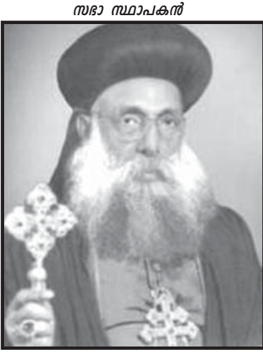
സഭാ സ്ഥാപകൻ ഗീവർഗീസ് മാർ ഇവാന്യോസ് തിരുമേനി

മലങ്കരയുടെ സാമൂഹ്യ ചരിത്രത്തിലും ആത്മീയ ചരിത്രത്തിലും എക്കാലവും വ്യക്തിമുദ്ര പതിപ്പിച്ച അതിധീമാനായിരുന്നു ബഥനി യുടെ മാർ ഇവാന്യോസ് തിരുമേനി (എം. എ. അച്ചൻ). പുനരെകു പ്രസ്ഥാനത്തിന്റെ ഉപജ്ഞാതാവും മലങ്കര കത്തോലിക്കാ സഭയുടെ കെടാവിളക്കായും അദ്ദേഹം ശോഭിക്കുന്നതിന്റെ പിന്നിൽ കണ്ണീരിൽ കുതിർന്ന പ്രാർത്ഥനാ ജീവിതമായിരുന്നു. ദയാ ജീവിതം തിരുമേനിയുടെ ശോഭയും മാറ്റും ആത്മീയ ശക്തിയും വർദ്ധിപ്പിച്ചു. ബഥനി സന്യാസപ്രസ്ഥാനത്തിന്റെ സ്ഥാപകനും സന്യാസ ശ്രേഷ്ഠനും ഒരു ഹഠയോഗിയുമായിരുന്നു അദ്ദേഹം. ജീവിതം കർമ്മം ചെയ്യാനുള്ളതാണെന്നുള്ള വിശ്വാസം അദ്ദേഹത്തിന് ഉൾക്കൊണ്ടിരിക്കുകയുണ്ടായിരുന്നു. ദീർഘവീക്ഷണവും കർമ്മശ്രേഷ്ഠതയുമുള്ള അപൂർവ്വം ചിലരിൽ ഒരാളാണ് ഈ വിശുദ്ധ പിതാവ്.